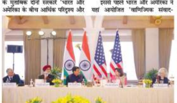
संबंधों को बढ़ाने को उचित कार्रवाई के लिए सीईओ फोरम की सिफारिशों की जांच करेंगे। 2023' के दौरान सेमीकंडक्टर आपूर्ति शृंखला तथा नवाचार साझेदारी पर एक सहमत पत्र (एमओयू) पर हस्ताक्षर भी

नई दिल्ली। भारत और अमेरिका के आर्थिक संबंधों को बढ़ाने के लिए क्या उचित कार्रवाई की जाए। इस संबंध में सीईओ फोरम की सिफारिशों पर दोनों देश गौर करेंगे। पीयूष गोयल और अमेरिकी वाणिज्य मंत्री ने यहां आयोजित भारत-अमेरिका सीईओ फोरम की बैठक की अध्यक्षता की। सीईओ फोरम की सह-अध्यक्षता टाटा संस के चेयरमैन एन चंद्रशेखरन और लॉकहीड मार्टिन के अध्यक्ष और मुख्य कार्यकारी अधिकारी जेम्स टैकलेट ने की। वाणिज्य एवं उद्योग मंत्रालय ने बताया कि केंद्रीय वाणिज्य और उद्योग मंत्री पीयूष गोयल और अमेरिकी वाणिज्य मंत्री जीना रायमोंडे ने यहां भारत-अमेरिका सीईओ फोरम की बैठक के बाद संयुक्त बयान जारी किया। संयुक्त बयान के मुताबिक दोनों सरकारें 'भारत और अमेरिका के बीच आर्थिक परिदृश्य और इससे पहले भारत और अमेरिका ने यहां आयोजित 'वाणिज्यिक संवाद' के दौरान सेमीकंडक्टर आपूर्ति शृंखला तथा नवाचार साझेदारी पर एक सहमत पत्र (एमओयू) पर हस्ताक्षर भी