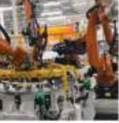
के चलते जनवरी, 2023 में औद्योगिक उत्पादन थोड़ा बेहतर रहा। एनएसओ के आंकड़ों के मुताबिक जनवरी में विनिर्माण क्षेत्र का उत्पादन 3.7 फीसदी बढ़ा है, जबकि एक साल पहले की समान

नई दिल्ली। अर्थव्यवस्था के मोर्चे पर राहत देने वाली खबर है। देश का औद्योगिक उत्पादन सूचकांक (आईआईपी) जनवरी में 5.2 फीसदी बढ़ा है। हालांकि, पिछले साल जनवरी महीने में औद्योगिक उत्पादन दो फीसदी बढ़ा था। आईआईपी के आधार पर माघ जन्मे वाला औद्योगिक उत्पादन दिसंबर, 2022 में 4.7 फीसदी बढ़ा था। राष्ट्रीय सांख्यिकी कार्यालय (एनएसओ) की ओर से जारी आधिकारिक आंकड़ों में यह जानकारी दी गई है। आंकड़ों के मुताबिक देश का उत्पादन सूचकांक (आईआईपी) जनवरी में 5.2 फीसदी बढ़ा है। एनएसओ ने कहा कि बिजली, खनन और विनिर्माण क्षेत्र के बेहतर प्रदर्शन का जवाबदा 12.7 फीसदी बढ़ा है। इसी तरह पूर्वीत वस्तुओं के खंड में जनवरी में 11 फीसदी की वृद्धि हुई, जबकि पिछले वित्त वर्ष के इस महीने में यह आंकड़ा 1.8 फीसदी था। आंकड़ों के मुताबिक उपभोक्ता टिकाऊ वस्तुओं के उत्पादन में 7.5 फीसदी की गिरावट आई है, जबकि एक साल की समान अवधि में इसमें 4.4 फीसदी की गिरावट रही थी। उपभोक्ता गैर-टिकाऊ वस्तुओं का उत्पादन 6.2 फीसदी बढ़ा है, जबकि एक साल पहले की समान