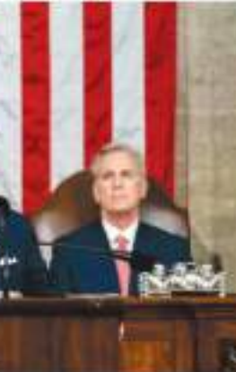
भारतवर्षी निकाई हेलेनी ने बजटीय प्रस्तावों के लिए बाइडन की आलोचना की है। उन्होंने कहा कि यह 3.9 करोड़ डॉलर का प्रस्तावों के लिए बाइडन की आलोचना की है। उन्होंने कहा कि

यह 3.9 करोड़ डॉलर का प्रस्तावों के लिए बाइडन की आलोचना की है। उन्होंने कहा कि