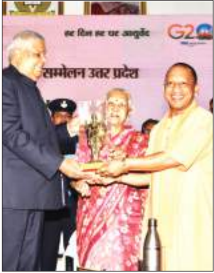
उत्तर प्रदेश की राज्यपाल आनंदी बेन पटेल, मुख्यमंत्री योगी आदित्यनाथ उपराष्ट्रपति को स्मृति चिन्ह भेंट करते हुए।