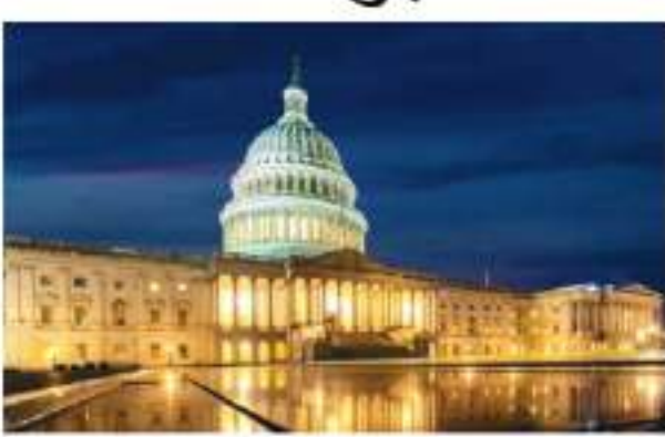
वास भेजा जाएगा। वह तय करने कि खुफिया एजेंसियों द्वारा इस

वाशिंगटन। अमेरिकी खुफिया एजेंसियों द्वारा जुटाई गई कोरोना वायरस की उत्पत्ति से जुड़ी गोपनीय जानकारी जल्द ही सार्वजनिक की जाएगी। अमेरिकी संसद में इस आशय का विधेयक पारित किया गया है। संसद के निचले सदन हाउस ऑफ रिप्रेजेंटेटिव्स (प्रतिनिधि सभा) में विधेयक पेश कर मांग की गई कि चीन के वुहान इंस्टीट्यूट ऑफ वायरोलॉजी और कोरोना वायरस की उत्पत्ति के