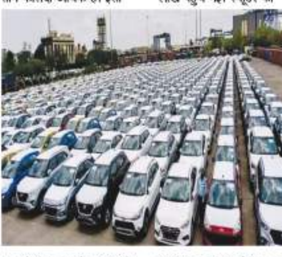
तारह दोपहिया वाहनों की बिक्री भी फरवरी महीने के दौरान आठ फीसदी बढ़कर 11,29,661 रही। पिछले साल फरवरी में 10,50,079 दोपहिया वाहन बिके थे। मोटरसाइकिल की बिक्री 6.58 लाख से बढ़कर 7.03 लाख पहुंच गई। स्कुटर की

नई दिल्ली। कर्ज के लगातार महंगे होने के साथ ही फिक्स्ट डिपॉजिट (एफडी) पर भी ब्याज लगातार बढ़ रहा है। छोटे बैंक अब वरिष्ठ नागरिकों को 9.25 फीसदी तक ब्याज दे रहे हैं। हालांकि, बड़े बैंक भी 8 से 8.50 फीसदी तक की पेशकश कर रहे हैं। उल्कर्न स्मॉल फाइनेंस बैंक ने कहा है कि वह वरिष्ठ नागरिकों को 700 दिन के जमा पर 9.25 फीसदी ब्याज देगा। अप्रैल में आरबीआई एक बार फिर से रेपो दर बढ़ाता है। तो एफडी पर और ज्यादा ब्याज मिल सकता है। ऐसे में आकर्षक रिटर्न के लिए इस समय डेट और फिक्स्ट इनकम केलाव सजित हो सकते हैं, खासकर तब जब इंडिटी बाजार में बहुत ज्यादा उतार-चढ़ाव है। कोटक और एसबीआई ने भी बढ़ाया ब्याज कोटक बैंक इस समय 390 दिन के एफडी पर 7.20 फीसदी और 364 दिन के एफडी पर 6.2 फीसदी ब्याज दे रहा है। एसबीआई 400 दिन के एफडी पर 7.10 फीसदी ब्याज दे रहा है। विशेषज्ञों का कहना है कि एफडी का चयन करते समय आपको उस अवधि को देखना चाहिए जिसके लिए आप निवेश करना चाहते हैं। यानी जब तक आपको पैसे की जरूरत न हो, आप तब तक के लिए निवेश कर सकते हैं। एक्सिस ने बढ़ाया 0.40 फीसदी ब्याज एक्सिस बैंक ने एफडी पर 0.40 फीसदी तक ब्याज बढ़ा दिया है। 13 मार्च से 24 मार्च के एफडी पर अब 7.15 फीसदी ब्याज मिलेगा जो पहले 6.75 फीसदी था। दो साल से छह साल के जमा पर 7.26 फीसदी का ब्याज मिलेगा। 30 महीने से 10 साल के एफडी पर 7 फीसदी का ब्याज मिल रहा है। नई दरें 10 मार्च से रूपा हो गई हैं।