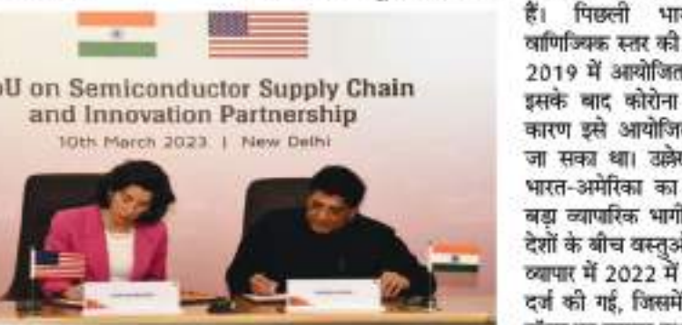
मंत्रालय के मुताबिक पीयूष गोयल ने अमेरिकी वाणिज्य सचिव जीना रायमोंडे के साथ प्रतिनिधिमंडल स्तर की चर्चा भी की है। इससे पहले पीयूष गोयल ने अमेरिका की वाणिज्य सचिव जीना रायमोंडे से यहां मुलाकात की। मंत्रालय के मुताबिक सेमीकंडक्टर सप्लाय चैन और

नई दिल्ली। सेमीकंडक्टर के क्षेत्र में चीन की नगमानी खत्म करने के लिए भारत ने अमेरिका के साथ एक समझौता किया है। दोनों देशों के बीच सेमीकंडक्टर मैनुफैक्चरिंग के लिए यह समझौता हुआ है। इसके साथ ही भारत-अमेरिका वाणिज्यिक संवाद में द्विपक्षीय व्यापार बढ़ाने, महत्वपूर्ण और उभरती प्रौद्योगिकियों में सहयोग और निवेश को बढ़ावा देने जैसे मुद्दों पर चर्चा होने की उम्मीद है। केंद्रीय वाणिज्य एवं उद्योग मंत्री पीयूष गोयल और अमेरिकी वाणिज्य मंत्री जीना रायमोंडे ने सेमीकंडक्टर आपूर्ति शृंखला स्थापित करने और नवाचार भागीदारी पर समझौता ज्ञापन पर हस्ताक्षर किए हैं। वाणिज्य एवं उद्योग मंत्रालय के मुताबिक भारत और अमेरिका ने सेमीकंडक्टर आपूर्ति शृंखला लचीलापन और विविधीकरण पर एक सहयोगी तंत्र स्थापित करने के लिए एक समझौता ज्ञापन (एमओयू) पर हस्ताक्षर किए हैं। इनोवेशन पार्टनरशिप की स्थापना के लिए एक समझौता ज्ञापन भारत के बंधु के तहत यूएस कर्माश्रितक