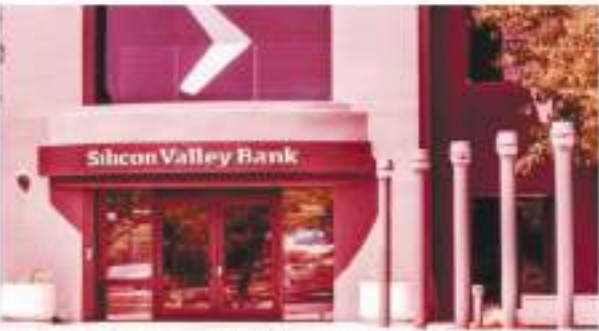
खबरें थमने का नाम नहीं ले रही है। कैलिफोर्निया के बाद अब सिलिकॉन वैली बैंक का संकट सामने आया है। जमाकर्ताओं का धन सुरक्षित करने के लिए अमेरिकी बैंकिंग नियामक ने

इस घटनाक्रम के बाद सिलिकॉन वैली बैंक के शेयरों में 66 प्रतिशत गिरावट दर्ज की गयी। इस कारण पूरी दुनिया में बैंकों के शेयरों में गिरावट देखी गयी। इस संकट का असर भारतीय स्टार्ट अप की दुनिया पर भी पड़ सकता है। सिलिकॉन वैली बैंक ने पेटीएम, नापोल, ब्ल्यूस्टोन जैसे 21 स्टार्टअप में निवेश कर रखा है। कई बैंचर कैपिटल कंपनियों का भी सिलिकॉन वैली बैंक से सम्बन्ध है। ऐसे में भारतीय बाजार में भी इस बैंक के बंद होने से हलचल देखी जा सकती है।