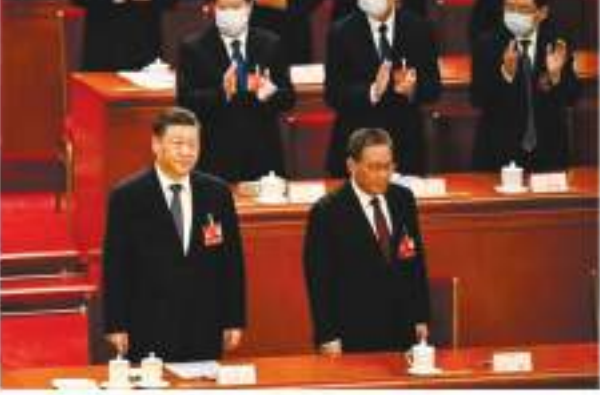
ली कियांग के करीबी हैं कियांग-63 वर्षीय ली कियांग को जिनिपिंग का करीबी माना जाता है। उन्हें जिनिपिंग के इंटरनल सर्कल में एक व्यापार-समर्थक राजनेता कहा जात है। नई सत्त सदस्यीय स्थायी समिति में शी के बाद ली कियांग दूसरे स्थान पर हैं।

शी जिनिपिंग को छोड़कर सभी शीर्ष अधिकारियों और मंत्रियों को बदला जाएगा। 63 वर्षीय कियांग राष्ट्रपति शी के करीबी सहयोगी हैं, जिन्हें अक्टूबर में आयोजित सीपीसी कांग्रेस में अल्पवय रीस्त्रे पांच साल के कार्यकाल के लिए प्रधानमंत्री चुना गया है।